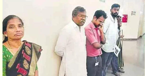
హైదరాబాద్ నవంబర్ 14 (ప్రజాక్షేత్రం):