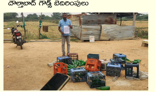
సంగారెడ్డి జిల్లా నవంబర్ 14 (ప్రజాక్షేత్రం)

- దుకాణం కావాలా గీ వ్రాణం కావాలా దొల్తాబాద్ గౌడ్ బెదిలంపులు