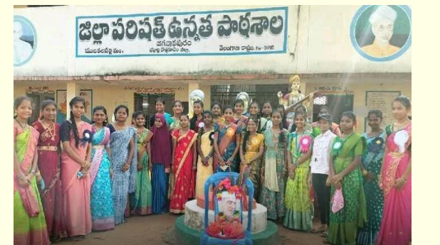
ములకపల్లి నవంబర్ 14(ప్రజాక్షేత్రం):

ములకపల్లి మండలంలోని జగన్నాథపురం జిల్లా పరిషత్ పాఠశాలలో బాలల దినోత్సవ వేడుకలను ఘనంగా నిర్వహించారు. విద్యార్థులు ఉపాధ్యాయుల పాత్రలు పోషించి తరగతి గదులలో పాఠాలను బోధించారు. ఈ కార్యక్రమంలో పాఠశాల ప్రధానోపాధ్యాయులు, ఉపాధ్యాయులు, విద్యార్థులు పాల్గొన్నారు.