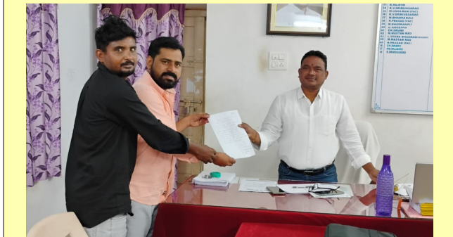
దమ్మపేట నవంబర్ 14 (ప్రజాక్షేత్రం):

మండల కేంద్రంలో లో ఖాళీగా ఉన్నటువంటి పాత ఎమ్మార్వీ ఆఫీస్ భవనాన్ని గ్రంథాలయానికి కేటాయించాలని ఎమ్మార్వీ గారికి వినతిపత్రం ఇవ్వడం జరిగింది. అందరికీ అనుకూలంగా అందుబాటులో మెయిన్ సెంటర్లో ఎంతో కాలం నుంచి నిరుపయోగంగా ఉన్నటువంటి పాత ఎమ్మార్వీ ఆఫీస్ భవనాన్ని గ్రంథాలయంగా మార్చుటయితే అందరికీ అందుబాటులో ఉంటూ విద్యార్థులకు సీనియర్ సిటిజన్స్ కు, ప్రజలకు ఎంతో ఉపయోగకరంగా ఉంటుందని, కావున దీనిపై పై అధికారులతో చర్చించి గ్రంథాలయానికి కేటాయించాలని ఎమ్మార్వీ గారిని కోరడం జరిగినది